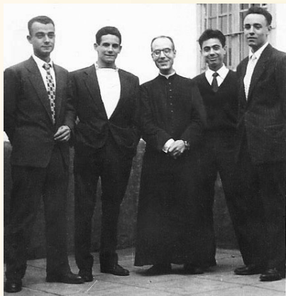
Con sus primeros dirigidos (1955)