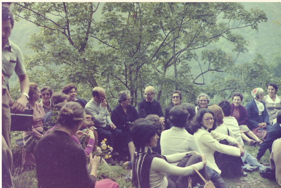
En Covadonga con el grupo y sus familiares (1976)