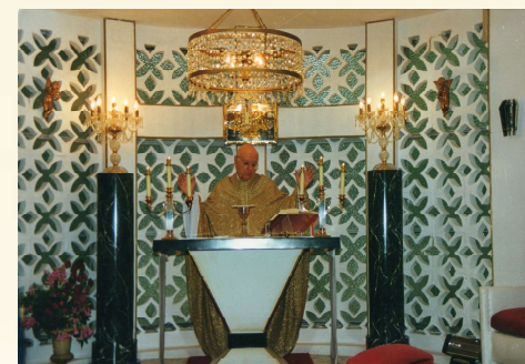
El Padre celebrando misa en el oratorio del Gardental de Cádiz

“No lo olvides: no es el hacer obras buenas, sociales..., lo que nos hace cristianos; sino el configurararnos con Cristo”.