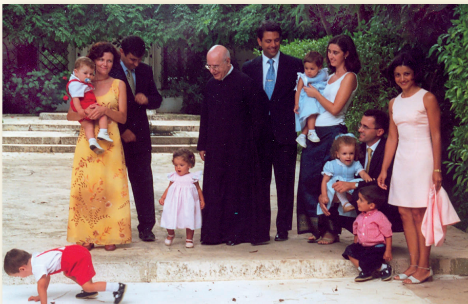
Con matrimonios en el Wikendal de Chiclana de la Frontera (2002)