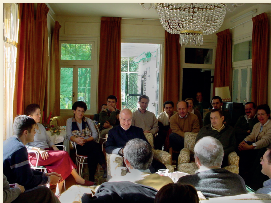
Tertulia en el Wikendal de Chiclana de la Frontera.