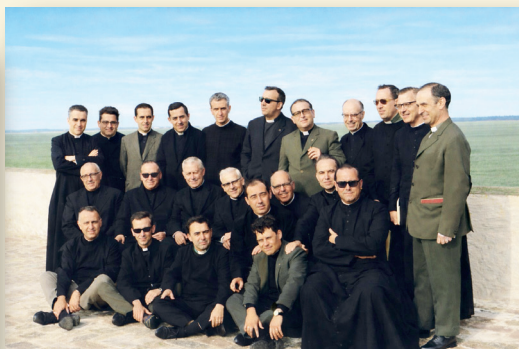
Con compañeros del Presbiterio Diocesano. Cádiz (1960)