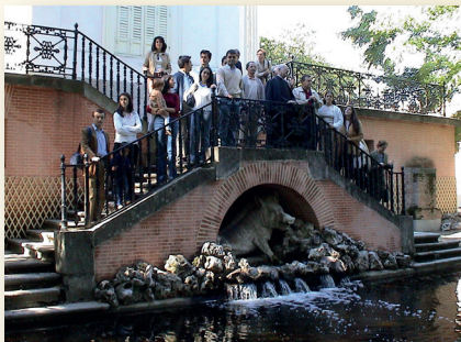
En los jardines del parque El Capricho. Madrid (2003)